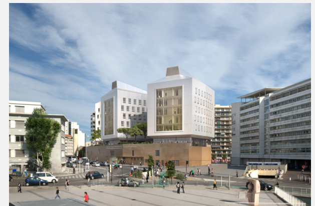
Autres sites à forte concentration