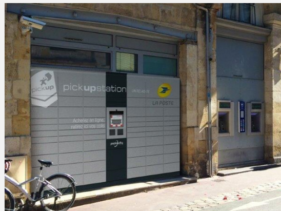
Cœurs de villes denses